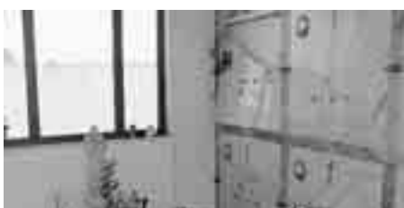
LA LAPIDE DANNEGGIATA

Sull'inqualificabile episodio sta indagando la polizia municipale della cittadina marina-