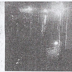
Uno dei tanti cantinati allagati nelle scorse ore